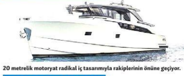
20 metrelik motorlu botun radikal iç tasarımıyla raketinin önüne geçiyor.