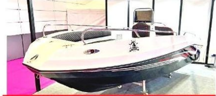
Hataylı öğrenciler yaptı

Tam uzunluğu 23,64 metre olan tekne fuarın en büyüğü konumunda. 4+1 kabin seçeneği sunan tekne, maksimum hızda 31-33 knot'a ulaşabiliyor. Kendi kategorisinde mutfak ve mürettebat için tamamen bölünmüş alanlar düzenleyen tekne, 8 kişilik bir ağırlama imkanı sunuyor.