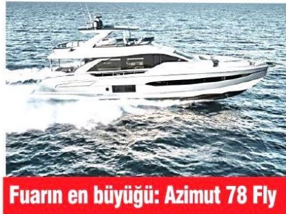
Fuarın en büyüğü: Azimut 78 Fly