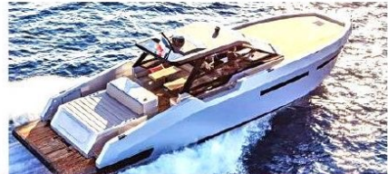
Fuarın en büyük yerlisi Mazu 52

YATED'in destek verdiği Hatay İskenderun'daki Sefa Atakaş Denizcilik Mesleki ve Teknik Anadolu Lisesi öğrencilerinin yaptığı balıkçı teknesi de fuarın ilgi görenleri arasındaydı. Yaşanan deprem felaketi sonrası harekete geçen YATED, öğrencilerin yaptığı 4,65 metre uzunluğa sahip tekneler için alım garantisi verdi.