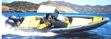
Rock Marine'in 30 fit uzunluğundaki botu Yunanistan'da üretiliyor.