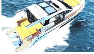
Hanse'nin bu modelindeki 300 PS güce sahip dıştan takma iki motora sahip.