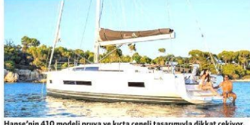
Hanse'nin 410 modelindeki pruva ve içi tasarımıyla dikkat çeken.