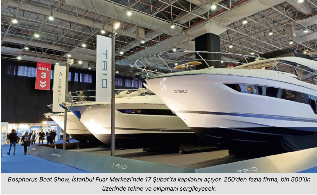
Bosphorus Boat Show, İstanbul Fuar Merkezi'nde 17 Şubat'ta kapılarını açıyor. 250'den fazla firma, bin 500'ün üzerinde tekne ve ekipmanı sergileyecek.