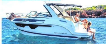
Spor bir tekne olmasına rağmen 4 kişinin uyuyabileceği bir kabine sahip.

boat show'ları takip ediyoruz. Dünyanın en büyük kapalı fuarı olan ve her ocak ayında Almanya'nın Düsseldorf kentinde gerçekleştirilen Boot Düsseldorf, tam bir denizcilik şehri havasında ge