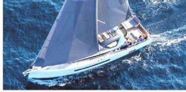
Jeanneau 55, yenilikçi ve cesur tasarımıyla katamaran konforunu sunuyor.